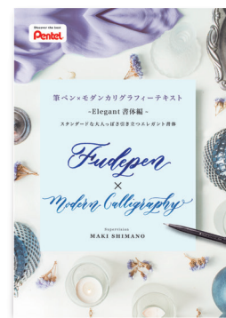
エレガントタイプ書体 http://www.pentel-fcg.jp/pdf/elegant01.pdf