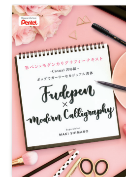
カジュアルタイプ書体 http://www.pentel-fcg.jp/pdf/casual01.pdf