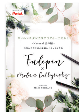
ナチュラルタイプ書体 http://www.pentel-fcg.jp/pdf/natural01.pdf