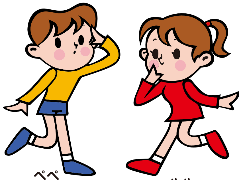
ほんとうのぺぺとルル