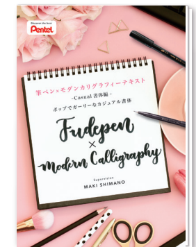
カジュアルタイプ書体 http://www.pentel-fcg.jp/pdf/casual01.pdf