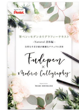
ナチュラルタイプ書体 http://www.pentel-fcg.jp/pdf/natural01.pdf