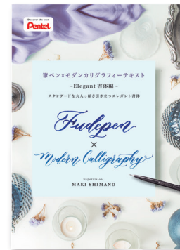
エレガントタイプ書体 http://www.pentel-fcg.jp/pdf/elegant01.pdf